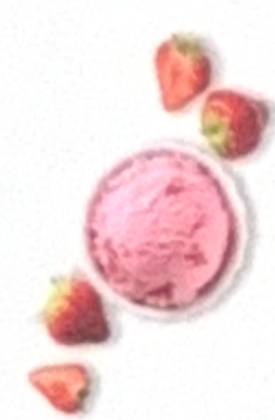
Cœur de fraise