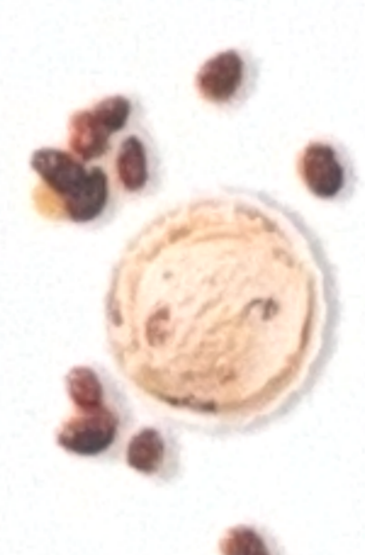
Rhum* raisins macérés