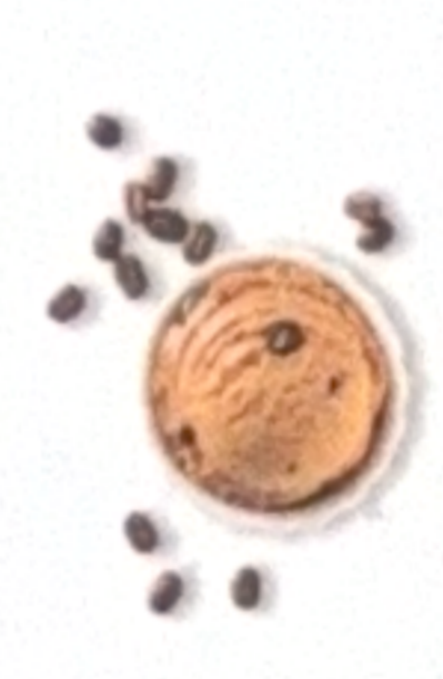
Café pur Arabica