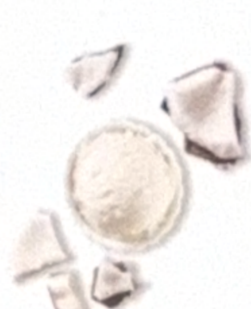
Noix de coco