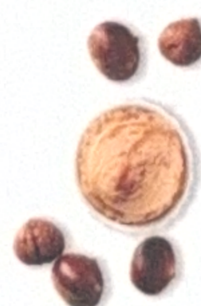
Marron à la crème de marron de l'Ardèche