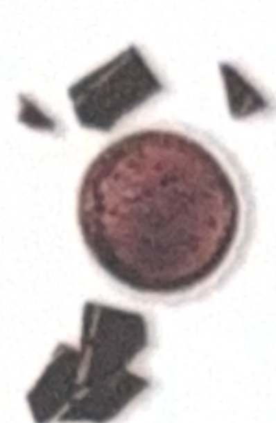
Chocolat et ses morceaux