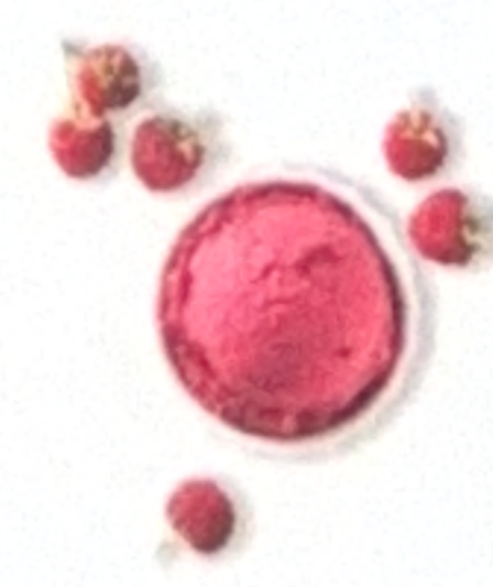
Douceur de framboise