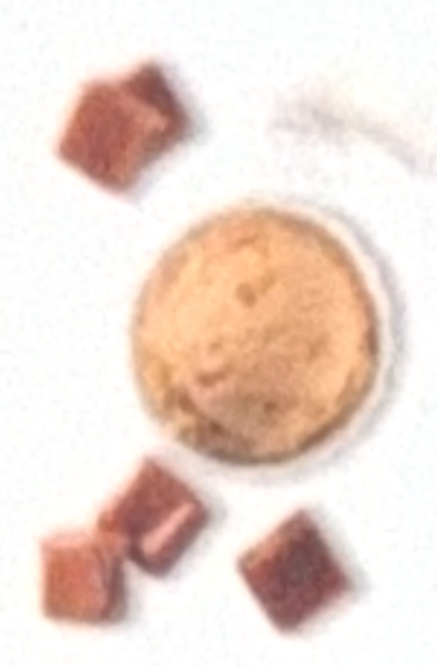
Caramel au beurre salé