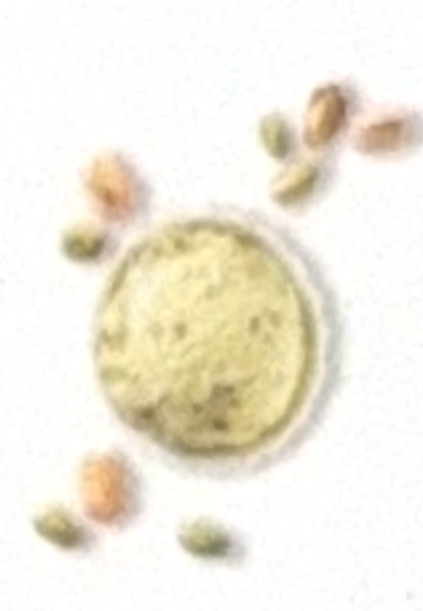
Pistache et ses morceaux