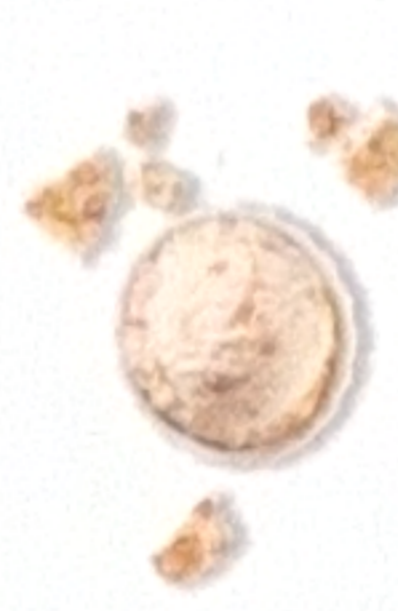
Nougat de Montélimar