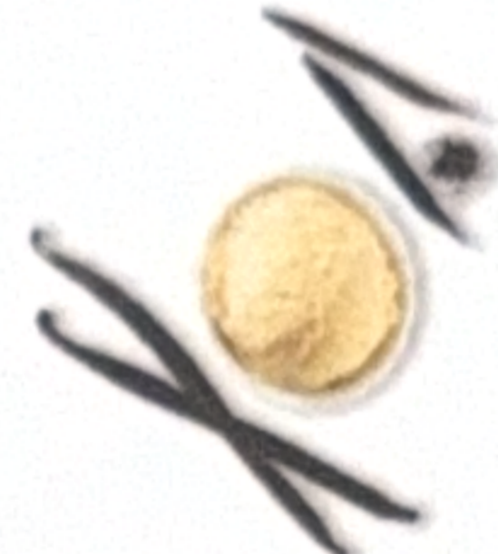
Vanille intense de Madagascar